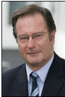
Dr. Klaus Kinkel Vorsitzender Bundesminister a. D.