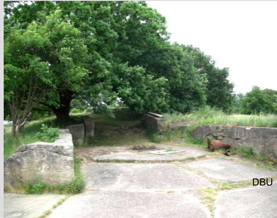
Überreste von der Abschussrampe