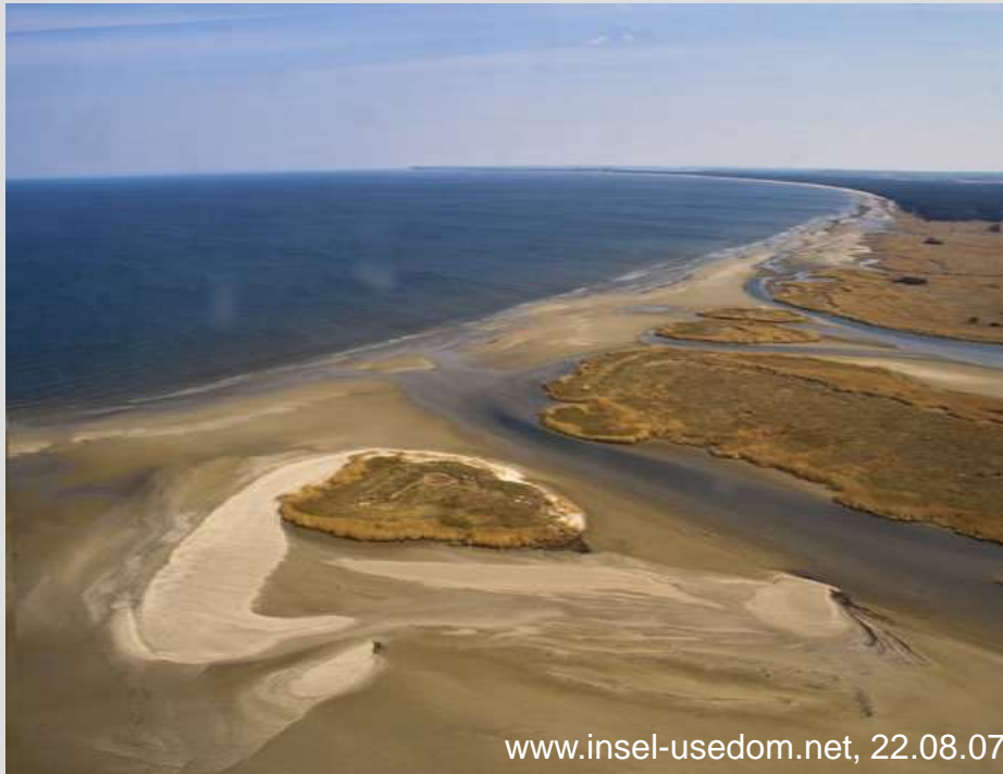
Anlandungszone an der Nordspitze Usedom