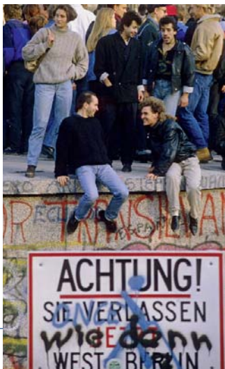
Mauerfall und Wiedervereinigung