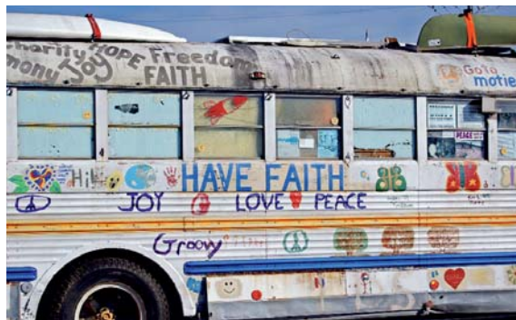
Friedensbewegung der 60er und 70er Jahre

NACHRICHTENDIENST DES DEUTSCHEN VEREINS FÜR ÖFFENTLICHE UND PRIVATE FÜRSORGE, FRANKFURT AM MAIN NR.3 | 1959