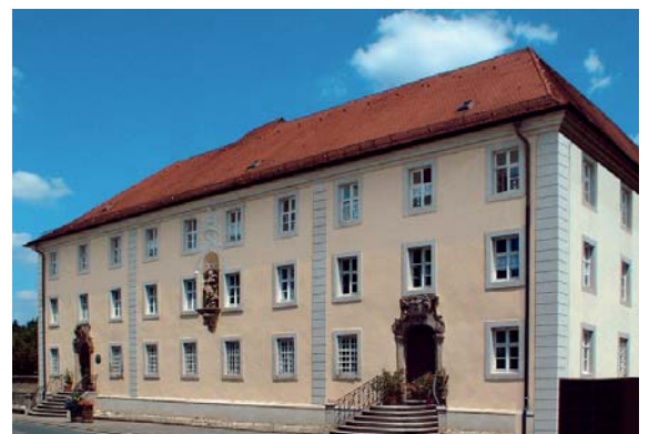
Die im 12. Jahrhundert gegründete St. Elisabeth-Hospital-Stiftung in Ellingen ist heute ein Altersheim.

Seit dem zwölften Jahrhundert sind die Stiftungen von Spitälern, Klerikerpründen, Schülerstipendien und schließlich Universitäten auch in Deutschland dicht überliefert. Eine starke Zunahme der Bevölkerung begünstigte die Gründung neuer und die Ausweitung alter Städte sowie eine erhöhte Mobilität aller Schichten, die auch die christlichen Werke der Barmherzigkeit vor unbekannte Aufgaben stellte. Die Armen pochten jetzt nicht mehr an die Pforten der alten Klöster auf dem Lande, sondern strömten in die Städte, in der die Amtskirche allein bei der Fürsorge überfordert gewesen wäre. Nicht bloß Könige, Adlige, Bischöfe und Mönche, sondern vor allem die Bürger selbst versorgten nun die Bedürftigen, zumal sie selbst als Händler und als Schüler „auf der Suche nach dem Wissen“ in der Fremde auf Hilfe angewiesen waren. Wie sie sich genossenschaftlich verbanden, um ihre angestammten Stadtherrschaften abzuschütteln und sich als Kommunen zu organisieren, so errichteten sie in Bruderschaften Spitäler, die neben den Notleidenden auch ihnen selbst im Alter eine sichere Behausung versprachen. Diese galten allerdings weiterhin als religiöse Einrichtungen und lehnten sich oft bei Kirchen oder Klöstern an. So stellte der Abt von St. Martin in Köln 1142/47 den Bürgern Grund und Boden für ein Spital zur Verfügung, das von diesen und den Mönchen finanziert werden sollte, dem aber ein „Laien-