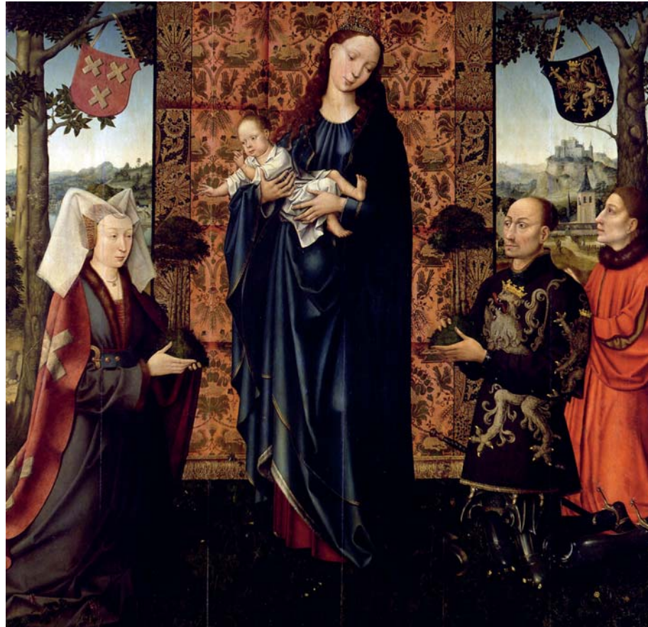
Das Bild des niederländischen Künstlers Goswijn van der Weyden, entstanden um 1511/15, zeigt Maria mit dem Kind und Stiftern.

Auch das Behindertenheim Johannishof in Hildesheim, der Hospitalfonds Sankt Benedikti in Lüneburg, der von der Klosterkammer Hannover verwaltet wird und neuerdings der Universität Lüneburg zugutekommt, sowie das „Gesundheitshaus“ in Münster/Westfalen beruhen auf Stiftungen der Stauferzeit. Die immer wieder genannten Jahre, etwa 1161 für Hildesheim oder 1176 für das ursprüngliche Magdalenenhospital in Münster, bezeichnen freilich nur mehr oder weniger markante Daten in einer schon älteren Geschichte der betreffenden Einrichtungen. Dass sie Bedeutung für die Gegenwart gewinnen konnten, lag abgesehen von den Stiftern selbst an der